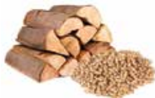
Pellets + Stückholz